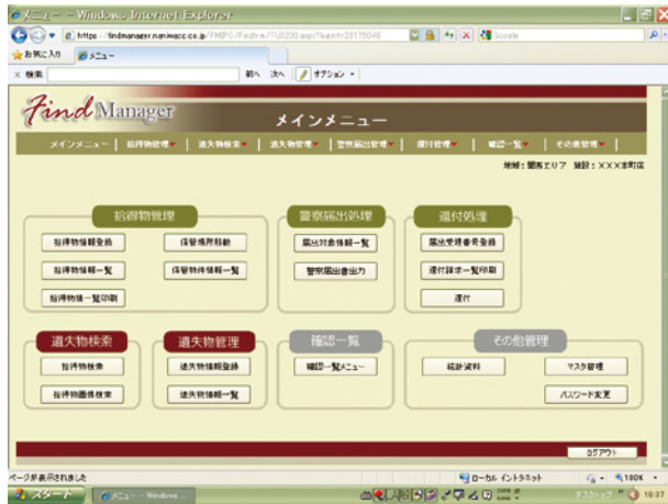
メインメニュー画面

プライベートクラウドシステムで利用する本製品は、Webアプリケーションなので、端末側で必要なものはWebブラウザだけで運用が可能です。また、拠点ごとはもちろん、地域ごとやグループ全体の拾得物・遺失物・還付など、各種統計を得ることができます。