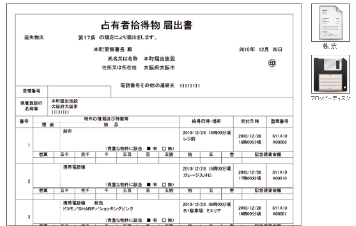
警察届出書出力(例)